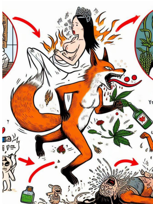
AI生成圖 / 陳銘華《荒誕集》：〈萬歲！萬歲〉